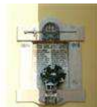
Pomník padlým v 1. sv. vojne (Hraničiarska ul., areál r. k. kostola sv. Michala )

Do tohto zoznamu boli zaradené aj nehnuteľné objekty našej MČ: