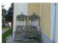
Rodinná hrobka Zsitvayovcov (Hraničiarska ul., areál r. k. kostola sv. Michala )