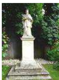
Socha sv. Jána Nepomuckého (ul. Sochorova, Na hrádzi )